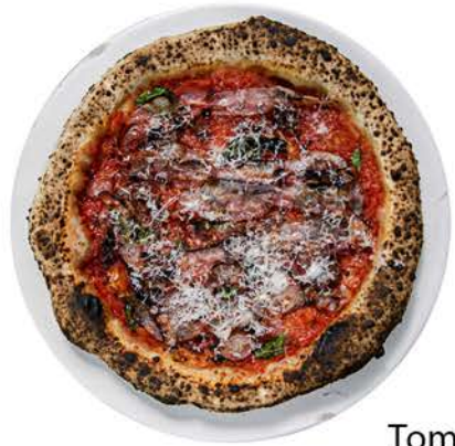
◀ AMATRICIANA Tomate, tocino en láminas, cebolla caramelizada y especias picantes. $204