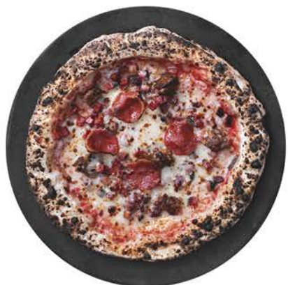
◀ MEATOPIA Mozzarella, salami, salchicha italiana y tocino / $214