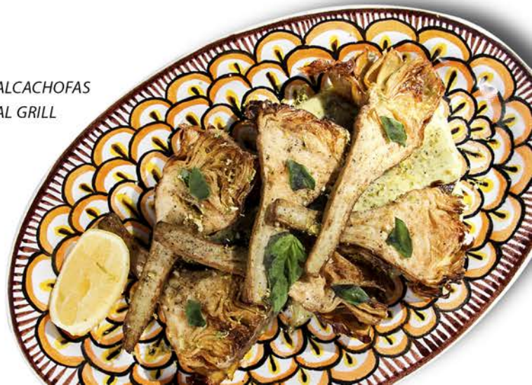
ALCACHOFAS AL GRILL

PULPO AL GRILL Pulpo con vinagreta de limón, arúgula, tzatziki y papas / $343