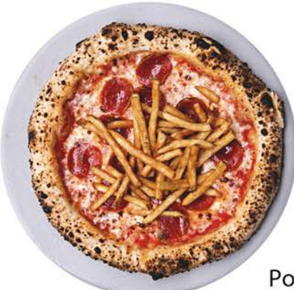
◀ BAMBINO Pomodoro, mozzarella, pepperoni y papas a la francesa. / $204